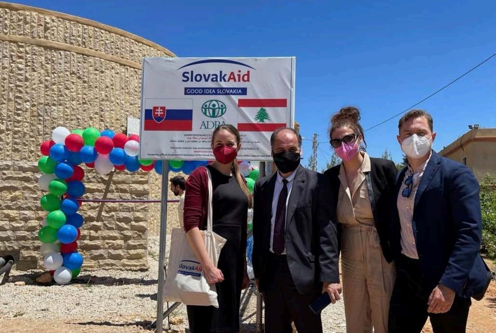
Časť štátnej delegácie SR počas návštevy SlovakAid projektov v Libanone.

Stálo by za to preskúmať, ako môže SR prepojiť humanitárnu pomoc s rozvojovou spoluprácou a ekonomickou diplomaciou, prípadne akademickou alebo kultúrnou výmenou, a kde môže nadviazať na odkaz Československa, prípadne spojiť sily pri súčasných aktivitách napríklad s ČR alebo s inými krajinami EÚ. Otázkou ostáva aj využitie existujúcich platforiem ako napr. Slavkovský formát 16 (spolupráca medzi SR, ČR a Rakúskom), ktorý SR hodnotí ako úspešný v iných partnerských krajinách SlovakAid.