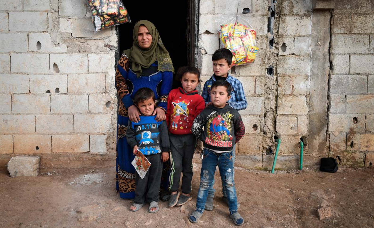
Vplyv desaťročnej vojny v Sýrii na životy celých rodín.

v ktorom opreli svoje migračné politiky o princíp tzv. flexibilnej, neskôr efektívnej solidarity. 1 To znamená, že spôsob, ako národné vlády členských štátov EÚ prispejú k riešeniu utečeneckej krízy, má ostať v ich diskrečnej právomoci s dôrazom na solidaritu prejavenu v zahraničí, aj cez humanitárnu pomoc poskytovanú do krajín pôvodu a tranzitu. V prípade postoja SR najmä smerom k Sýrii, Libanonu a Iraku.