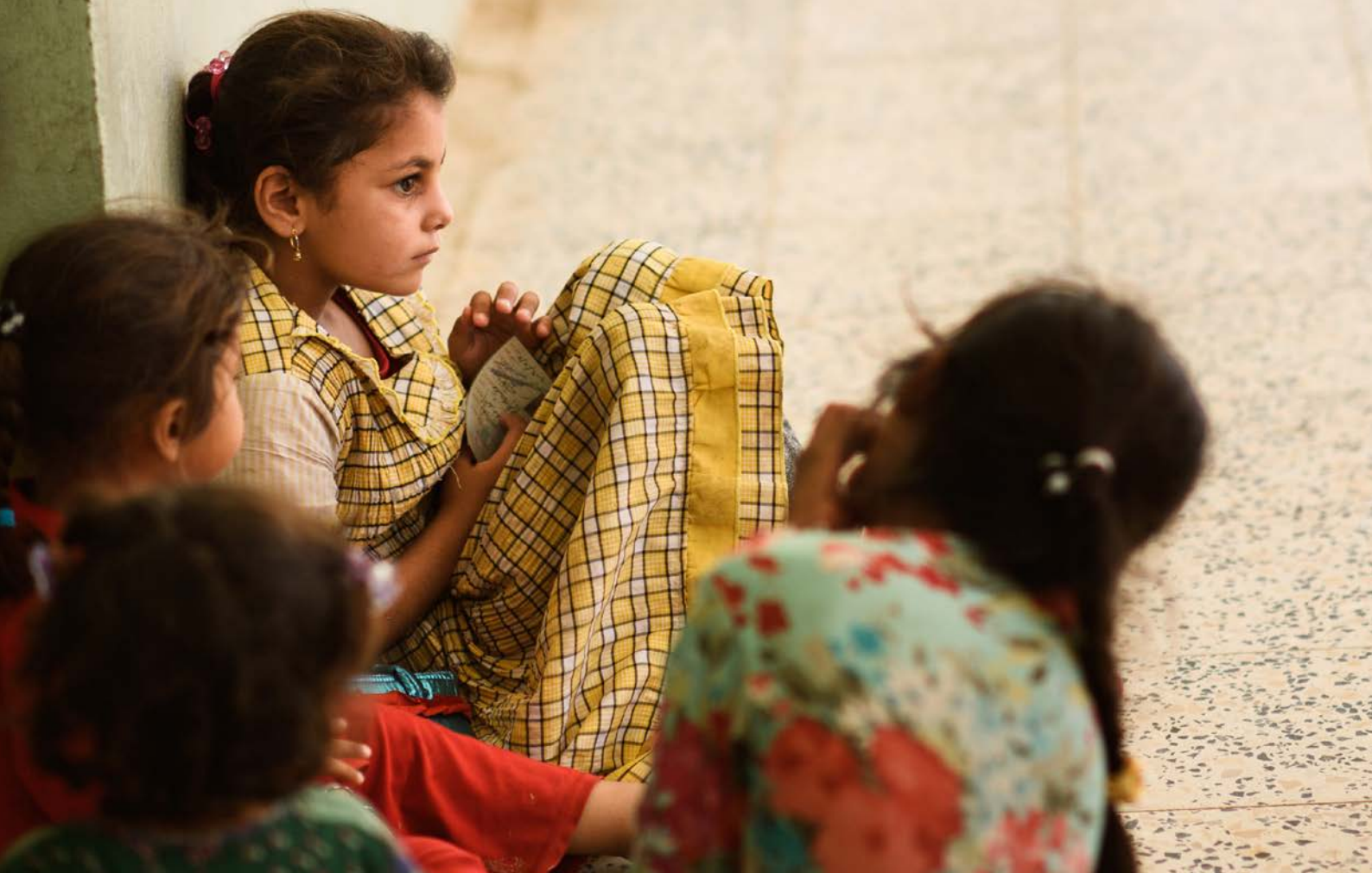
Iracké deti čakajúce na výučbu.

Dlhodobá neexistencia a odkladanie vytvorenia humanitárnej stratégie a i fakt, že napriek viacerým argumentom sa žiadna z krajín Blízkeho východu nestala programovou krajinou SlovakAid, znásobujú otázky, do akej miery v praxi prikladá SR dôležitosť svojim humanitárnym intervenciám resp. konceptu tzv. efektívnej solidarity na Blízkom východe.