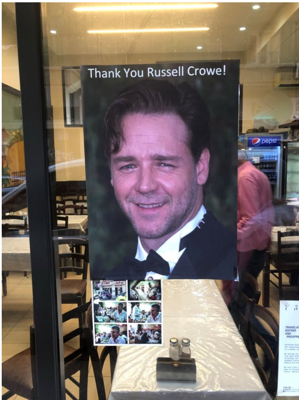
Russell Crowe v bejrútské restauraci.