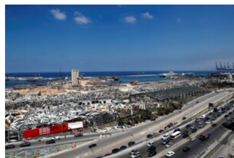
📷 Rok po výbuchu v bejrútskom prístave (11 fotografií)