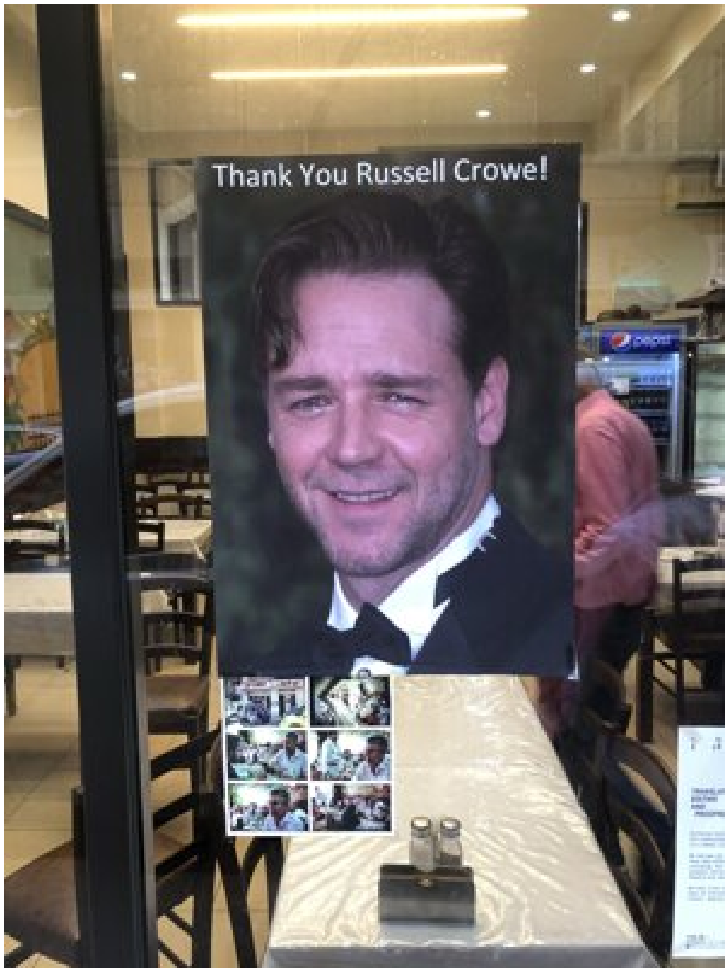
Poďakovanie slávnemu hercovi.